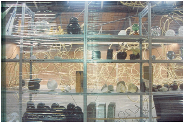
(The memory wall)