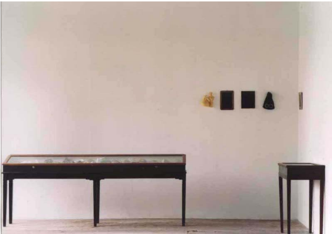
(The memory archive)